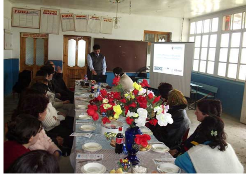
Küdürlü kənd sakinləri açıq şəkildə öz şikayətlərini söyləyirlər

orqanları bu problemə sadəcə göz bağlayır. Görüş çərçivəsində 9 nəfər müvafiq hüquqi məsləhət almış, 2 nəfər isə tədbirdən sonra Layihənin Şəki ofisinə şikayət məktubu yollamışdılar.