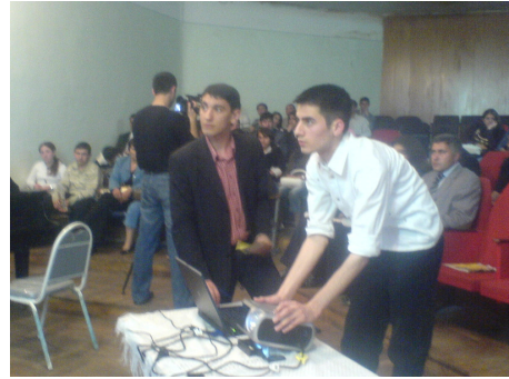
Gəncə tələbələri korrupsiyaya qarşı mübarizə sahəsinə maraq nümayiş etdirirlər

Cari ilin May ayının 25-də layihənin Lənkəran ofisinin əməkdaşları Lerik rayonunun Azərbaycan kəndində, Lerik rayonu Milli QHT Forumu Şöbəsinin dəstəyi ilə yerli çayxanada 11 nəfər kişi ilə görüş keçirmişdir. Görüş zamanı kənd sakinlərinə hüquqşünas tərəfindən onları narahat edən məsələlər haqqında məsləhətlər verilmişdir. Sakinlər daha çox sosial müdafiə və məhkəmə sisteminə hökm sürən korrupsiya hallarından şikayətlənirdilər.