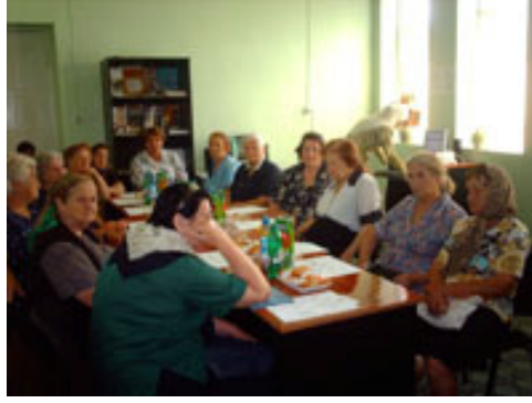
Qubada rus icması üçün keçirilən seminar

Layihənin Şəki ofisi cari ilin İyulun 11-də Şəki şəhərinin Şəki kəndində şəhər icra hakimiyyəti və yerli bələdiyyənin dəstəyi ilə kənd sakinləri görüş keçirmişdir. Sakinlər daha çox pasport qeydiyyat idarəsi və həmçinin plastik bank kartlarının alınmasında müşahidə olunan problemlər ilə bağlı şikayətlənirdilər. Şikayətçilərə yerində hüquqi yardım göstərilmiş və onların müraciətləri aidiyyatı orqanlara göndərilmişdir.