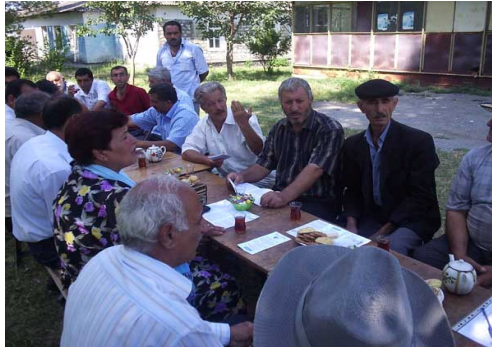
Şəki kəndinin sakinləri üçün seminar

Layihənin Şəki ofisi cari ilin İyulun 11-də Şəki şəhərinin Şəki kəndində şəhər icra hakimiyyəti və yerli bələdiyyənin dəstəyi ilə kənd sakinləri görüş keçirmişdir. Sakinlər daha çox pasport qeydiyyat idarəsi və həmçinin plastik bank kartlarının alınmasında müşahidə olunan problemlər ilə bağlı şikayətlənirdilər. Şikayətçilərə yerində hüquqi yardım göstərilmiş və onların müraciətləri aidiyyatı orqanlara göndərilmişdir.