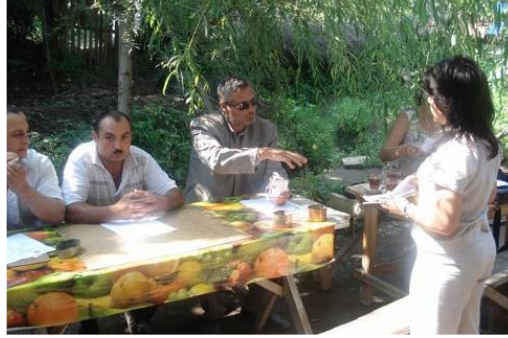
Şəmkir rayonu sakinləri ilə görüş

Layihənin Gəncə ofisi cari ilin İyulun 20-də Şəmkir rayonunda 30 nəfər yerli sakin üçün seminar keçirmişdir. Sakinləri Layihənin xidmətləri ilə bağlı tanış edən layihə əməkdaşları onlara yerində hüquqi yardım göstərmişdir. Sakinlər daha çox bələdiyyə, icra hakimiyyəti və polisin işi ilə bağlı öz narazılıqlarını bildirirdilər.