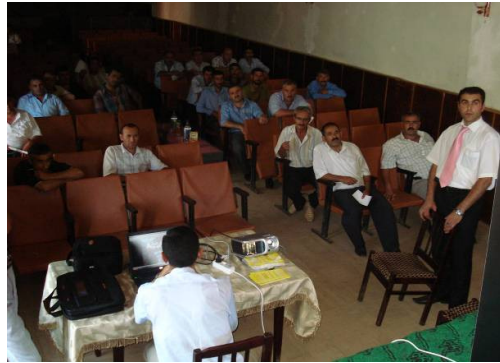
Yardımlı sakinləri ilə keçirilən görüş

Layihənin Lənkəran ofisi cari ilin İyulun 27-də Yardımlı rayon İcra Hakimiyyəti ilə birgə rayonun Mədəniyyət evində ictimaiyyət nümayəndələri ilə görüş keçirmişdir. Görüş zamanı iştirakçılar daha çox torpaqların qeyri-qanuni satışı ilə bağlı şikayətlər ilə çıxış edirdilər. Layihənin hüquqşünası şikayətçilərə hüquqi məsləhət göstərərək onlara şikayət prosedurunu başa salmışdır. Yazılı şikayətlər öz növbəsində aidiyyəti orqanlara göndərilmişdir.