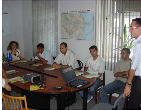
“Azərbaycan İnsan Hüquqları Fondu”nda keçirilən seminar

Layihənin Bakı ofisi cari ilin Sentyabrın 22-də “Azərbaycan İnsan Hüquqları Fondu” QHT-si ilə birgə müxtəlif Universitetlərdən olan tələbələr üçün seminar təşkil etmişdir. Seminarda “Transparency International” təşkilatı haqqında məlumat, onun Azərbaycan bölməsinin fəaliyyəti, ALAC layihəsi, onun xidmət və uğurları barədə iştirakçılara məlumat verilmişdir. Seminarda həmçinin korrupsiyaya qarşı mübarizə vasitələri ilə bağlı müzakirə keçirilmişdir. Gənclər daha çox təhsil sahəsində rüşvətin mövcudluğu ilə bağlı şikayətlərlə çıxış edirdilər.