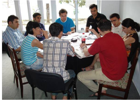
Lənkəran ofisində keçirilən görüş

Cari ilin Avqustun 4-də Layihənin Lənkəran ofisində Avrasiya Fondunun Azərbaycan Gənclər Fondunun Məsləhət Şurasının Birinci Regional Görüşü keçirilmişdir. Tədbirdə gənclər siyasəti və gənclərin üzləşdikləri problemlər barədə fikir mübadiləsi aparılmışdır.