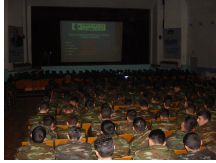
Müdafiə Nazirliyinin zabit heyəti üçün Bakıda keçirilən seminar

Korrupsiyaya qarşı Mübarizə üzrə Milli Strategiya”da nəzərdə tutulan tədbirlər planı, “Transparency International” təşkilatı haqqında məlumat, onun Azərbaycan bölməsinin fəaliyyəti, ALAC layihəsi, onun xidmət və uğurları barədə iştirakçılara məlumat verilmişdir. Seminarda həmçinin korrupsiyaya qarşı mübarizə vasitələri ilə bağlı müzakirə keçirilmişdir.