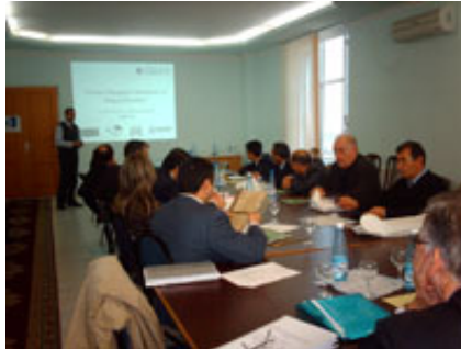
Qubada keçirilən dəyirmi masa

Cari ilin Dekabrın 12-də Layihənin Quba ofisinin əməkdaşları ABŞ-ın Beynəlxalq İnkişaf Agentliyinin həyata keçirdiyi Parlament Proqramı çərçivəsində Qubada Millət vəkllərinin köməkçiləri üçün təşkil olunmuş dəyirmi masa müzakirəsində iştirak etmişlər. Tədbir zamanı, iştirakçılara “Şəffaflıq Azərbaycan” təşkilatının missiya və xidmətləri barədə məlumatlar görüş iştirakçılarının nəzərinə çatdırılmışdır.