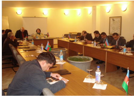
Lənkəranda keçirilən görüş

Cari ilin Dekabrın 24 və 25-də Layihənin Lənkəran ofisinin əməkdaşları Ombudsman Aparatının cənub zonasında fəaliyyət göstərən bələdiyyə, QHT-lər və mətbuat üçün təşkil etdikləri tədbirdə iştirak etmişlər. Tədbirdə regionda insan hüquqlarının qorunması ilə bağlı vəziyyət ətrafında fikir mübadiləsi aparılmışdır.