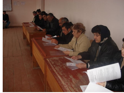
Ziyadlı kənd sakinləri ilə görüş

Layihənin Lənkəran ofisi cari ilin Oktyabrın 14-də Lənkəran şəhərinin Xolmoli kəndində 38 nəfər kənd sakini ilə görüş keçirmişdir. Görüş zamanı iştirakçılar daha çox torpaqların qeyri-qanuni satışı, sosial yardımın verilməməsi, məktəblərdə olan rüşvət halları ilə bağlı şikayətlər ilə çıxış edirdilər. Layihənin hüquqşünası şikayətçilərə hüquqi məsləhət göstərərək onlara şikayət proseduru başa salmışdır. Yazılı şikayətlər öz növbəsində aidiyyəti orqanlara göndərilmişdir.