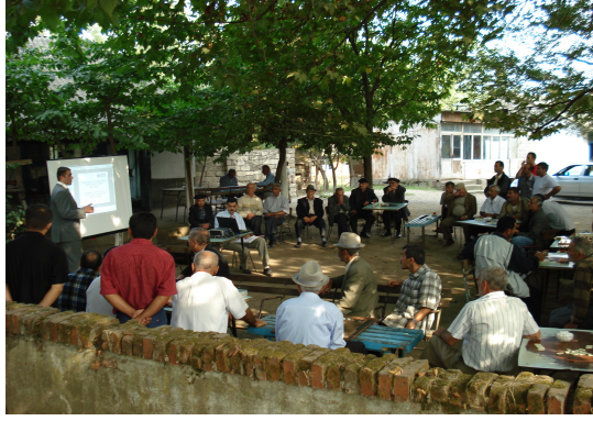
Lankaranın Xolmoli kəndində keçirilən təlim

Layihənin Quba ofisi cari ilin Oktyabrın 8-də Quba rayonunun Buduq kəndində 31 nəfər kənd sakini üçün seminar keçirilmişdir. İcma nümayəndələri daha çox kommunal xidmətlərin aşağı keyfiyyəti, sosial yardım və pasport qeydiyyatı ilə bağlı şikayətlər ünvanlayırdılar.