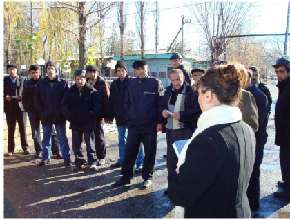
Şəkinin Bideyiz kəndinin sakinləri üçün seminar

Layihənin Şəki ofisi cari ilin Oktyabrın 14-də Şəki şəhərinin Bideyiz kəndində yerli bələdiyyənin dəstəyi ilə 38 nəfər kənd sakini görüş keçirmişdir. Sakinlər daha çox kommunal xidmətlər və ünvanlı sosial yardımın verilməməsi ilə bağlı şikayətlənirdilər. Şikayətçilərə yerində hüquqi yardım göstərilmiş və onların müraciətləri aidiyyətli orqanlara göndərilmişdir.