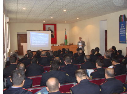
Polis idarələrində keçirilən təlimlər

Layihə, yerli QHT-lər ilə sıx qarşılıqlı əməkdaşlıq edirlər. Bir çox hallarda təşkilat yerli QHT-lərə müraciət edərək birgə tədbirlərin keçirilməsi təklifi ilə çıxış edir. Bəzi hallarda isə müxtəlif QHT-lər təşkilatın yerli ofislərindən müəyyən tədbirlərin keçirilməsi üçün istifadə edirlər.