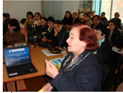
Bakı Pedaqoji Kadrların İxtisasartırma İnstitutunda keçirilən təlimlər