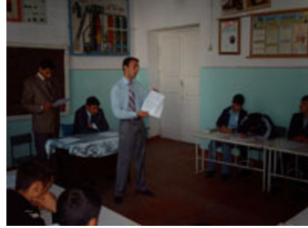
Qubanın Buduq kəndində keçirilən seminar

Layihənin Şəki ofisi cari ilin Oktyabrın 14-də Şəki şəhərinin Bideyiz kəndində yerli bələdiyyənin dəstəyi ilə 38 nəfər kənd sakini görüş keçirmişdir. Sakinlər daha çox kommunal xidmətlər və ünvanlı sosial yardımın verilməməsi ilə bağlı şikayətlənirdilər. Şikayətçilərə yerində hüquqi yardım göstərilmiş və onların müraciətləri aidiyyətli orqanlara göndərilmişdir.