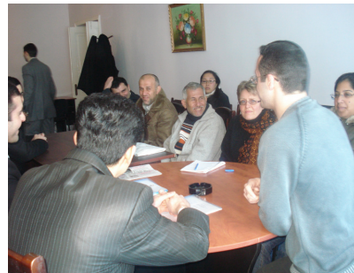
“Şəffaflıq Azərbaycan” öz təcrübəsi ilə bölüşür