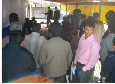
Masallının Qarqalıq kəndində keçirilən təlim

Layihənin Lənkəran ofisi cari ilin Martın 18-də Masallı rayonunun Qarqalıq kəndində 30 nəfər kənd sakini ilə görüş keçirmişdir. Görüş zamanı iştirakçılar daha çox özəl sektor, yol-tikinti sahəsi, poçt və yerli icra nümayəndəliklərində olan korrupsiya halları ilə bağlı şikayətlər ilə çıxış edirdilər. Layihənin hüquqşünası şikayətçilərə hüquqi məsləhət göstərərək onlara şikayət prosedurunu başa salmışdır. Yazılı şikayətlər öz növbəsində aidiyyəti orqanlara göndərilmişdir.