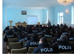
Polis İdarələrində keçirilən seminarlar