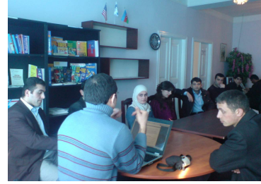
“Şəffaflıq Azərbaycan”-nın Lənkərandə yerli QHT-lərin iştirakı ilə keçirilən tədbirlər

Cari ilin Yanvarın 9-da Quba Mərkəzində Milli QHT Forumunun Quba üzrə Regional QHT-lərin Təlim-Resurs Mərkəzinin əməkdaşları ilə regionda erkən niğahlar mövzusu ətrafında fikir mübadiləsi aparılmışdır.