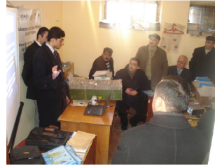
Dövlət Sosial Müdafiə Fondunun Gəncə və Lənkəran üzrə Ərazi İdarələrində keçirilən seminarlar