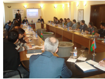
Lənkəranda Müdafiə Nazirliyinin Hərbi Qarnizonu, Rabitə və İnformasiya Texnologiyaları Nazirliyi və Daşınmaz Əmlakın Dövlət Reyestr Xidmətinin Ərazi İdarələrində keçirilən seminarlar

“Transparency International” təşkilatının Qazaxıstan və Qvatemala ölkələrindəki nümayəndəliklərinin əməkdaşları “Şəffaflıq Azərbaycan” İB-ynin həyata keçirdiyi “İctimai Maraqların Qorunması və Hüquqi Məsləhət Mərkəzi” Layihəsinin Azərbaycandakı tətbiqi təcrübəsindən istifadə etmək məqsədilə cari ilin Yanvar-Fevral aylarında Bakıda səfərdə olmuşlar. Səfər çərçivəsində onlar öz ölkələrində analoji layihənin həyata keçirilməsi məqsədilə “Şəffaflıq Azərbaycan”ın Bakı ofisinin əməkdaşları tərəfindən təlim keçiblər.