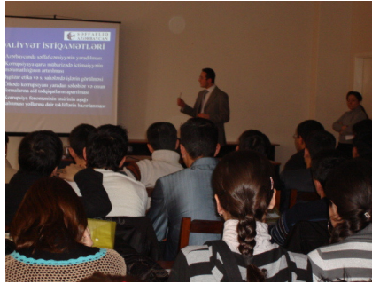
Turizm İnstitutunda təhsil alan tələbələr üçün keçirilən seminar

Layihənin Bakı ofisi cari ilin Fevralın 27-də Turizm İnstitutunun 100 nəfərlik tələbə heyəti üçün seminar təşkil etmişdir. Təlim xarakteri daşıyan görüş zamanı tələbələrin nəzərinə korrupsiyanın anlayışı, onun səbəbləri, nəticələri və formaları haqqında və təşkilatın həyata keçirdiyi “İctimai Maraqların Müdafiəsi və Hüquqi Məsləhət Mərkəzi” Layihəsinin fəaliyyəti və xidmətləri ilə bağlı məlumatlar çatdırılıb. Seminar zamanı həmçinin “turizm və korrupsiya” mövzusu ətrafında müzakirə aparılmışdır.