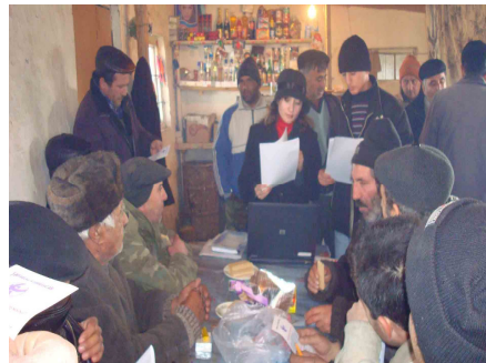
Şəkinin Bolludərə kəndinin sakinləri üçün seminar

Layihənin Şəki ofisi cari ilin Fevralın 4-də Şəki şəhərinin Bolludərə kəndində 38 nəfər kənd sakini görüş keçirmişdir. Sakinlər daha çox kommunal xidmətlər, hərbi kommissarlıq, səhiyyə və məhkəmələrin işi ilə bağlı şikayətləndirdilər. Şikayətçilərə yerində hüquqi yardım göstərilmişdir.