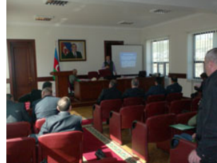
Vergilər Nazirliyi və Nazirliyin Ərazi İdarələrində keçirilən seminarlar