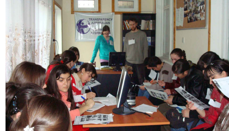
Şəki mərkəzində şagirdlər üçün ingilis dilində keçirilən debatlar