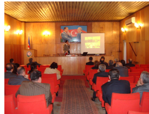
İcra Hakimiyyətlərində keçirilən seminarlar