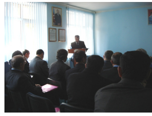
Azərbaycan Respublikası Auditorlar Palatasında keçirilən seminar