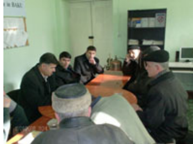
Qubada keçirilən dəyirmi masa

Cari ilin Yanvarın 9-da Quba Mərkəzində Milli QHT Forumunun Quba üzrə Regional QHT-lərin Təlim-Resurs Mərkəzinin əməkdaşları ilə regionda erkən niğahlar mövzusu ətrafında fikir mübadiləsi aparılmışdır.