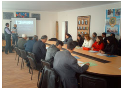
Qubada orta məktəb direktorları üçün keçirilən seminar

Layihənin Quba ofisi cari ilin Martın 19-da Quba şəhərində yerləşən orta məktəblərin 30 nəfərdən ibarət direktorları üçün seminar keçirilmişdir. Maarifləndirmə xarakteri daşıyan seminar zamanı tədbir iştirakçılarının nəzərinə korrupsiyanın anlayışı, onun səbəbləri, nəticələri və formaları haqqında, “Şəffaflığın artırılması və Korrupsiyaya qarşı mübarizə üzrə Milli Strategiyanın” icrası üzrə tədbirlər planı, “Transparency International” təşkilatı və onun yerli bölməsi sayılan “Şəffaflıq Azərbaycan” təşkilatının fəaliyyət istiqamətləri və təşkilatın həyata keçirdiyi “İctimai Maraqların Müdafiəsi və Hüquqi Məsləhət Mərkəzi” Layihəsinin fəaliyyəti və xidmətləri ilə bağlı məlumatlar çatdırılıb.