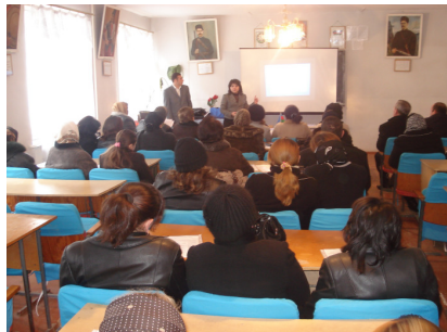
Xətai kənd orta məktəbində keçirilən seminar

Layihənin Gəncə ofisi cari ilin Fevralın 20-də Ağstafa rayonunun Xətai kəndində yerləşən orta məktəbin 50 nəfərlik müəllim heyəti üçün seminar keçirmişdir. Müəllimləri layihənin xidmətləri ilə bağlı tanış edən mərkəzin əməkdaşı şikayəti olanlara yerində pulsuz hüquqi yardım göstərmişdir. Kənd sakinlər daha çox daşınmaz əmlakın qeydiyyatı və məhkəmələrdə korrupsiya faktlarının olduğu bağlı öz narazılıqlarını bildirirdilər.