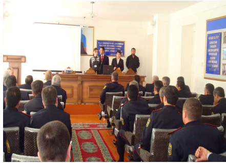
Yuxarıdakı şəkil: Şəki rayon Polis Şöbəsində keçirilən seminar

Layihənin Şəki mərkəzi cari ilin Aprelin 17-də Şəki rayon Polis Şöbəsinin əməkdaşları üçün korrupsiya və şəffaflıq mövzusunda seminar keçirib. Seminar zamanı tədbir iştirakçılarının nəzərinə korrupsiyanın anlayışı, onun səbəbləri, nəticələri və formaları haqqında, “Şəffaflığın artırılması və Korrupsiyaya qarşı mübarizə üzrə Milli Strategiya”nın hüquq mühafizə orqanlarının fəaliyyətinin təkmilləşdirilməsi üzrə tədbirlər planı, “Transparency International” təşkilatı və onun yerli bölməsi sayılan “Şəffaflıq Azərbaycan” İB-nin fəaliyyət istiqamətləri və İB-in həyata keçirdiyi “İctimai Maraqların Müdafiəsi və Hüquqi Məsləhət Mərkəzi” Layihəsinin fəaliyyəti və xidmətləri ilə bağlı məlumatlar çatdırılıb.