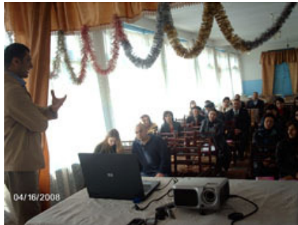
Yuxarıdakı şəkil: Nüqədi kəndində keçirilən seminar

Layihənin Quba mərkəzi cari ilin Aprelin 16-da Quba rayonunun 1-ci Nüqədi kəndinin 1 saylı orta məktəbinin müəllimləri üçün seminar keçirib. Seminar zamanı maarifləndirmə kursundan əlavə, şikayəti olan vətəndaşlara pulsuz hüquqi məsləhətlər verilib. Vətəndaşlar daha çox kommunal xidmətlər, polis, məhkəmə, bələdiyyə, hərbi kommissarlıq və səhiyyə sahələrində üzləşdikləri korrupsiya hallarından şikayətlənirdilər.