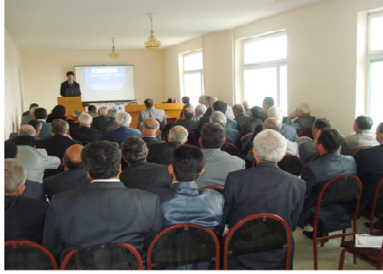
Yuxarıdakı şəkil: Masallı şəhər Təhsil Şöbəsinə keçirilən seminar

Layihənin Lənkəran mərkəzi cari ilin Aprelin 17-də Masallı şəhər Təhsil Şöbəsinin 70 nəfərlik əməkdaşı üçün seminar keçirib.