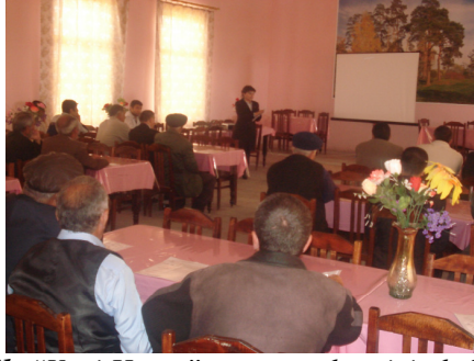
Yuxarıdakı şəkil: “Yeni Həyat” qaçqın şəhərciyində keçirilən seminar

Layihənin Lənkəran mərkəzi cari ilin Aprelin 17-də Masallı şəhər Təhsil Şöbəsinin 70 nəfərlik əməkdaşı üçün seminar keçirib.