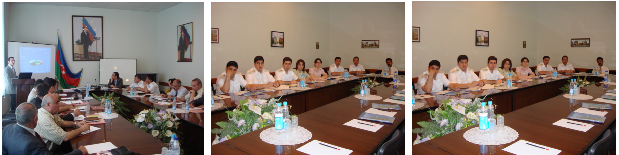
Yuxarıdakı şəkil: Ədliyyə sisteminin əməkdaşları üçün keçirilən seminarlar

“Şəffaflıq Azərbaycan” Korrupsiyaya Qarşı Mübarizə İctimai Birliyi həyata keçirdiyi “İctimai Maraqların Müdafiəsi və Hüquq Məsləhət Mərkəzi” Layihəsi, habelə “Şəffaflığın artırılması və Korrupsiyaya qarşı mübarizə üzrə Milli Strategiya”nın maarifləndirmə komponenti çərçivəsində cari ilin İyunun 10-u, 11-i və 12-də Azərbaycan Respublikası Ədliyyə Nazirliyinin Akademiyasında bələdiyyə üzvləri, məhkəmə icraçıları və hakimlər üçün seminarlar keçirib. Seminar zamanı tədbir iştirakçılarının nəzərinə korrupsiyanın anlayışı, onun səbəbləri, nəticələri və formaları haqqında, “Şəffaflığın artırılması və Korrupsiyaya qarşı mübarizə üzrə Milli Strategiya”nın icrası üzrə tədbirlər planı, “Transparency International” təşkilatı və onun yerli bölməsi sayılan “Şəffaflıq Azərbaycan” İB-nin fəaliyyət istiqamətləri və İB-in həyata keçirdiyi “İctimai Maraqların Müdafiəsi və Hüquqi Məsləhət Mərkəzi” Layihəsinin fəaliyyəti və xidmətləri ilə bağlı məlumatlar çatdırılıb. Keçirilən seminarlar zamanı bələdiyyələrə və məhkəmə orqanlarına vətəndaşlar tərəfindən gələn şikayətlərin xarakteri, Milli Strategiyadan irəli gələn vəzifələr müzakirə olunmuş və qeyd olunan sahələrdə korrupsiya faktlarının aradan qaldırılması imkanları ətrafında fikir mübadiləsi aparılmışdır.