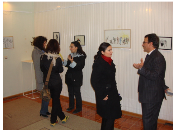
Yuxarıdakı şəkillərdə: Sərgi zamanı

“Qaradağ Sement” ASC-nin rəhbərliyi sərginin qonaqları olaraq, həmin karikaturaları kitabça şəklində çap etməyi təklif etmişdirlər. Həmin təklifin nəticəsində “Korrupsiya ilə üz-üzə” karikaturalar kitabçası “Qaradağ Sement” ASC-nin maliyyə dəstəyi ilə nəşr olunmuşdur və bu gün, 11 dekabr, “Milli Antikorrupsiya Həftələri” kampaniyasının son günündə, geniş ictimaiyyətə təqdim olunur.