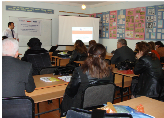
Yuxarıdakı şəkillərdə: Seminarlar zamanı